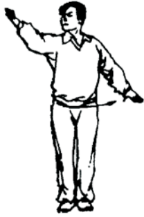
28.15 Au sol

Le juge de plateforme tend un bras à l'oblique paume vers le haut désignant le compétiteur, et déplace son autre bras légèrement fléchi, paume vers le bas, horizontalement de l'abdomen vers le coté de son corps.