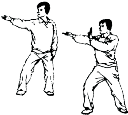
28.18 Sortie Rouge/Bleu

Le juge de plateforme tend les deux bras devant à l'horizontal, puis les abaissent paumes vers le bas.