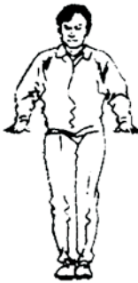
28.17 Chute simultanée

Le juge de plateforme tend un bras en direction du compétiteur qui est tombé le premier, puis dit "Rouge ou Bleu" et croise ses avant bras devant lui les paumes vers le sol.