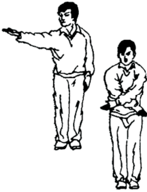
28.16 Premier au sol

Le juge de plateforme tend un bras à l'oblique paume vers le haut désignant le compétiteur, et déplace son autre bras légèrement fléchi, paume vers le bas, horizontalement de l'abdomen vers le coté de son corps.