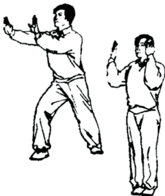
28.19 Sortie simultanée

Le juge de plate forme tend un bras en direction du compétiteur qui est tombé/sortie de la plateforme, puis en arc et flèche «弓步 Gong Bu », pousse son autre paume vers l'avant.